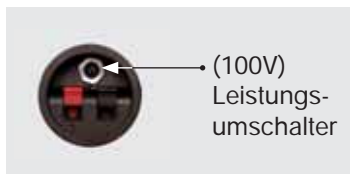
Anschlussklemme (Standard 100V)