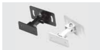
Schwenk/Neige-Halterung (Option) schwarz oder weiß