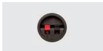
Anschlussklemme (Standard 80hm)