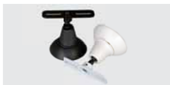
Halterung mit Kugelgelenk (Option) schwarz oder weiß